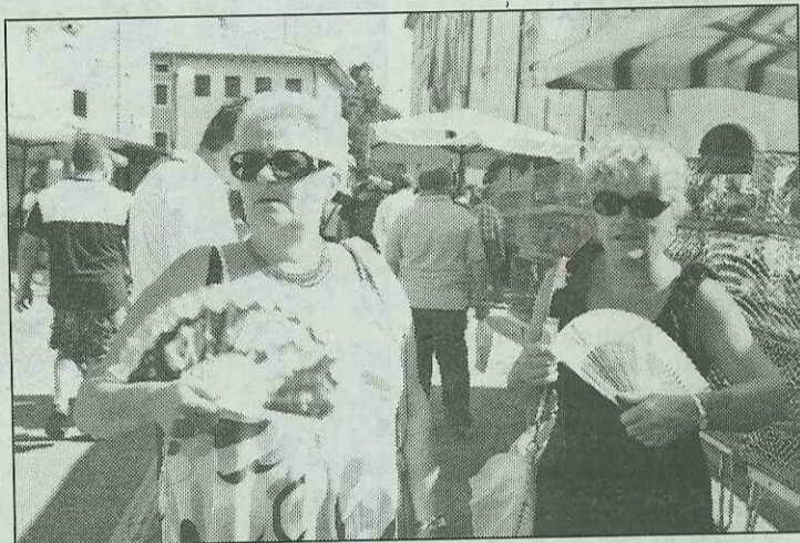
PUBBLICO Visitatrici all'ultima edizione della Sagra dei osei

Dura con chi ha contestato la manifestazione: «Ci usano per attribuirci accuse che non meritiamo in quanto da anni ormai stiamo lavorando per adeguarla ai tempi pur mantenendo la tradizione». Non poteva mancare un commento sul pranzo che ha suscitato tanto scalpore: «È stato un rinfresco, un gesto di ospitalità dovuto alle autorità e alle delegazioni straniere presenti al Campionato europeo di cioccolato, al quale hanno contribuito un operatore sacilese, l'Anu, il ristoratore, i commercianti,